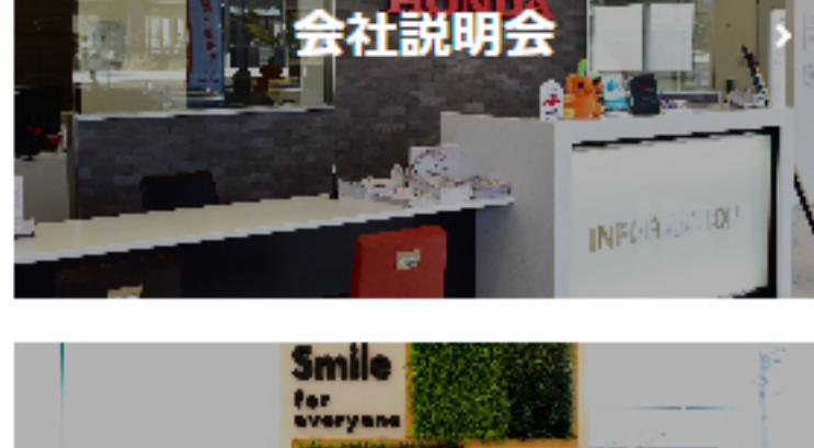
エントリーフォーム