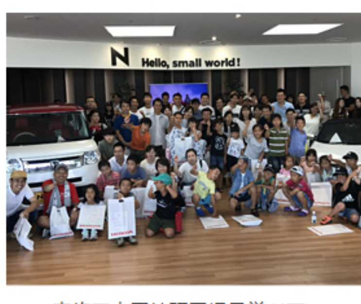
家族で本田技研工場見学ツアー