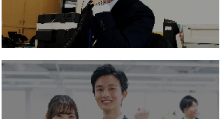
インターンシップ