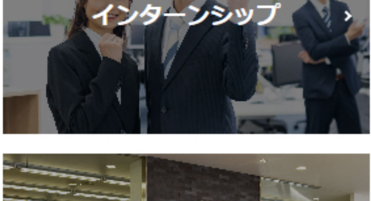
会社説明会申込み