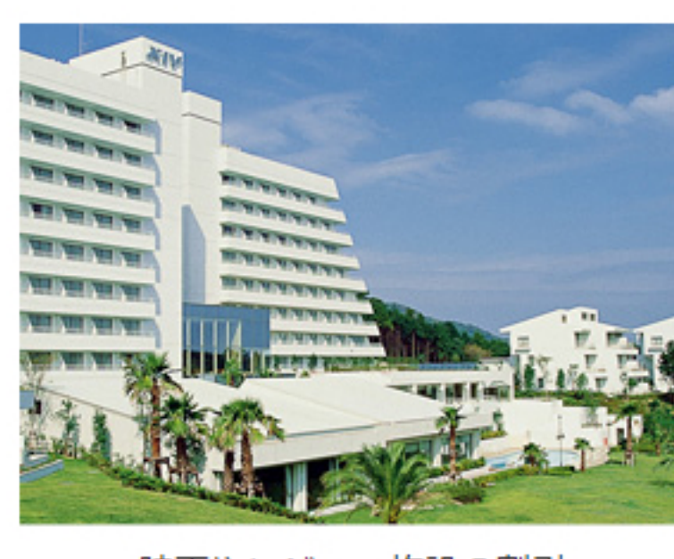
映画やレジャー施設の割引